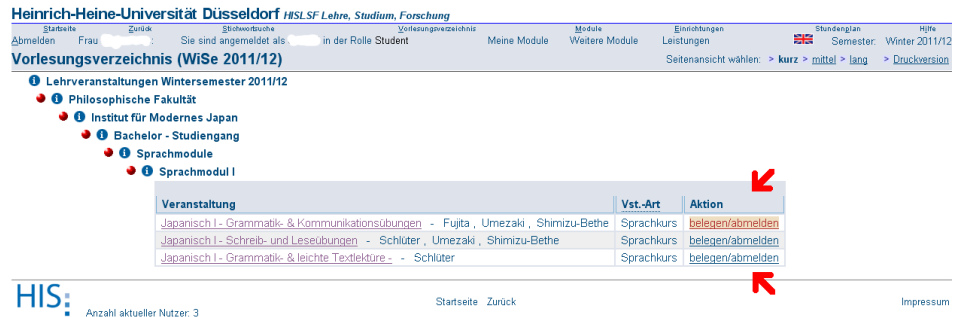
Abbildung 1: Belegen von Veranstaltungen aus dem Vorlesungsverzeichnis