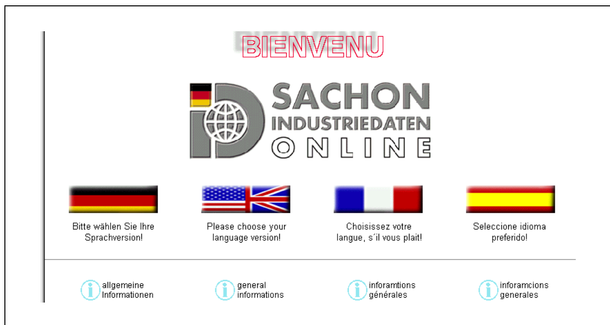
Abbildung 2.9-1: Sachon Industriedaten. Eingangsbildschirm

Industriedatenbank Sachon Verlag GmbH & Co. ist eine 100%-Tochtergesellschaft der Verlagsgruppe Sachon Holding GmbH & Co. mit Sitz in Mindelheim. Das "klassische" Printprodukt des Unternehmens ist das Nachschlagewerk "Die deutsche Industrie - Made in Germany", das in Zusammenarbeit mit dem Bundesverband der Deutschen Industrie e.V. (BDI) herausgegeben wird. Daneben erarbeitet Sachon in Kooperation mit dem Zentralverband Elektrotechnik- und Elektronikindustrie e.V. (ZVEI) ein Fachadressbuch der Elektrobranche. Die Industriedatenbank konzentriert sich auf Firmen- und Produktinformationen, auch und vor allem unter dem Aspekt des Exports. Der 1945 gegründete Verlag erzielt mit knapp 150 Mitarbeitern einen Jahresumsatz von 22 Mio. DM (2000).