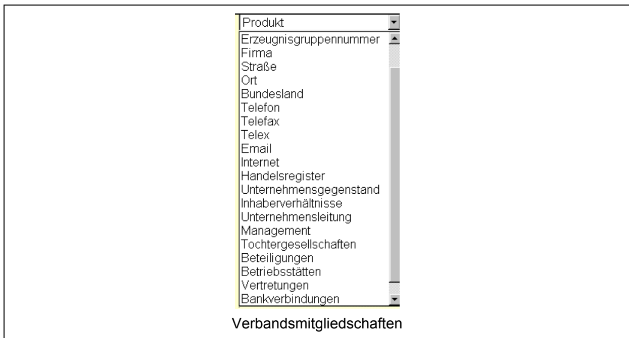
Abbildung 2.9-2: Sachon. Alphanumerische Erfassungs- und Suchfelder

Die Export-Datenbank umfasst knapp 30.000 Einträge, die ZVEI-Datenbank kommt auf 5.268 Dossiers (Juli 2001). Retrievalsystem und Websitegestaltung erfolgen bei beiden Datenbanken analog, ebenso das Datenbankdesign sowie die eingesetzte Dokumentationsmethode (jeweils ein umfassendes Klassifikationssystem). Unser Test konzentriert sich auf die Export-Datenbank.