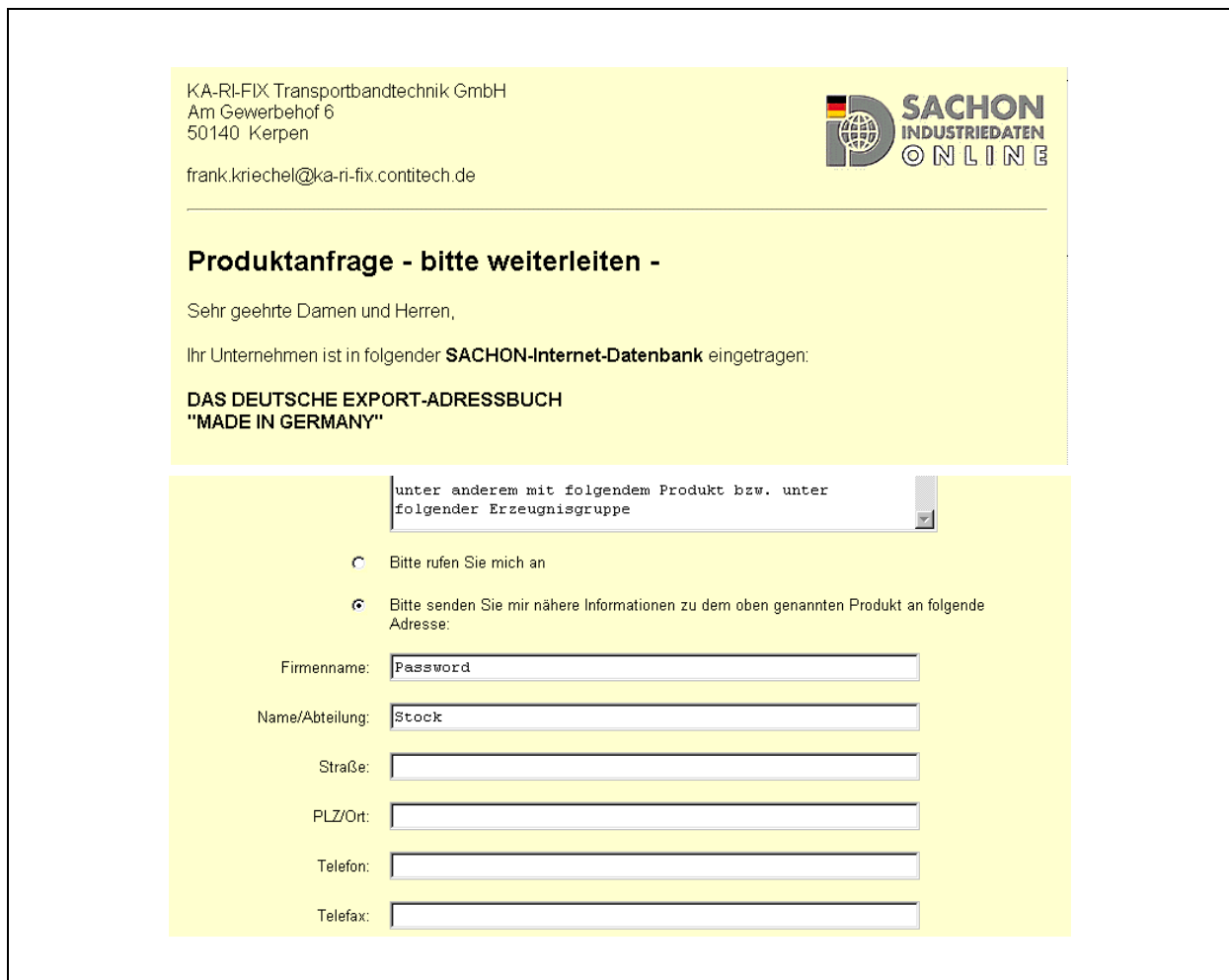
Abbildung 2.9-15: Sachon. Kontaktaufnahme