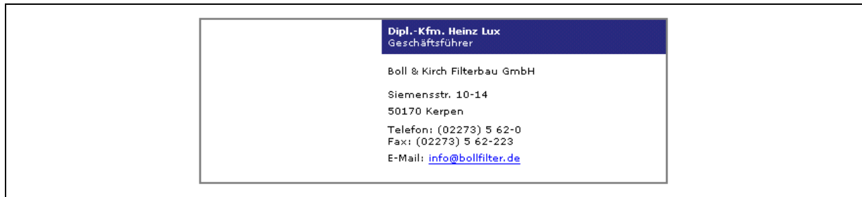
Abbildung 2.6-8: Hoppenstedt bizbook. Datensatzbeispiel Boll & Kirch (Heinz Lux)

mehr, wenn man bedenkt, dass Hoppenstedt über entsprechende Informationen verfügt (vgl. fastX). Nach Angaben von Hoppenstedt vermissen die Kunden der Firmendatenbank die (früher dort vorhandenen) Bilanzdaten allerdings kaum.