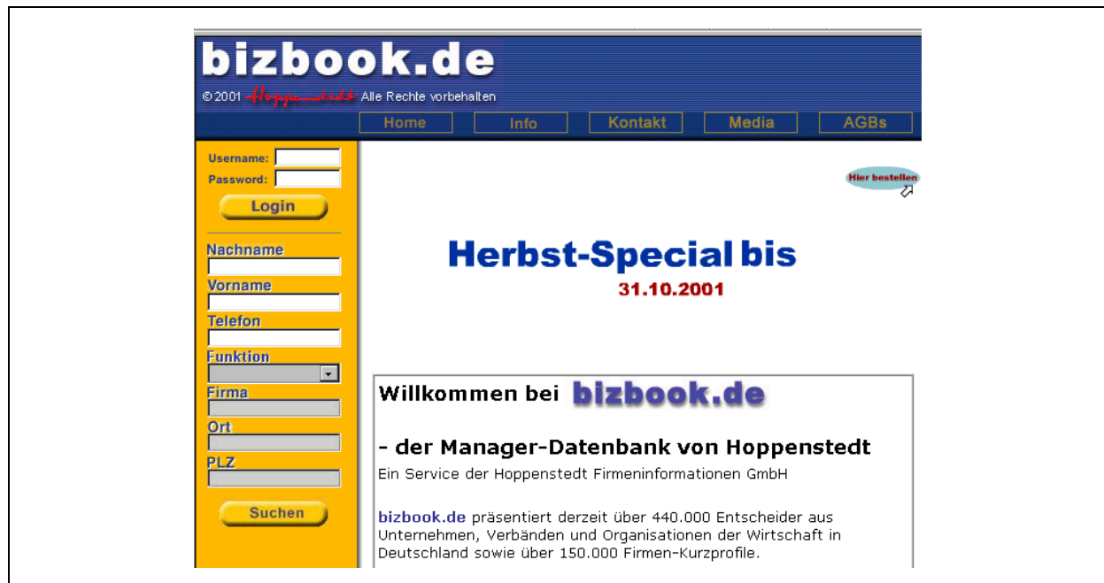
Abbildung 2.6-5: Hoppenstedt bizbook

Das Schema der (kostenlosen bzw. kostenpflichtigen) Suchfelder für die Varianten der Firmendatenbank soll folgende Tabelle verdeutlichen: