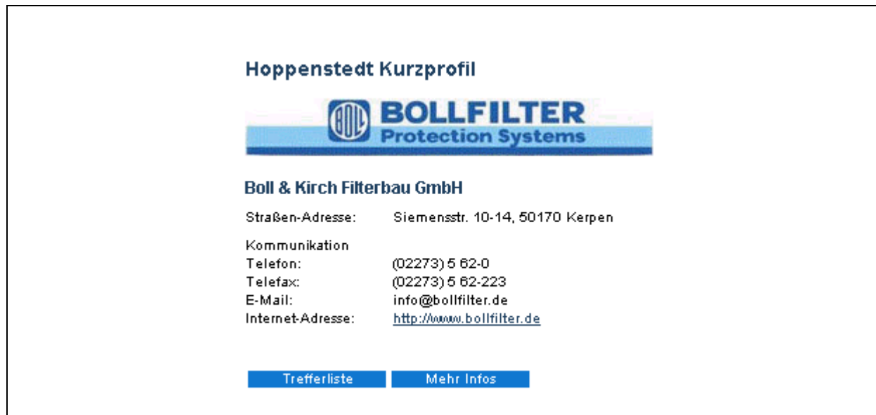
Abbildung 2.6-7: Hoppenstedt Firmendatenbank. Datensatzbeispiel Boll & Kirch (kostenfreie Variante)

Hoppenstedt prüft die Richtigkeit der Angaben anhand des Bundesanzeigers, der Geschäftsberichte, der Presse sowie - und dies ist mit Abstand die wichtigste Quelle - der Selbstauskünfte der Unternehmen. Die Hoppenstedt-Redaktion erhebt ja nach Firmengröße drei- bis fünfmal im Jahr die Daten schriftlich direkt bei den Unternehmen bei namentlich bekannten Ansprechpartnern. Wenn jemand mehrfach nicht reagiert, wird telefonisch nachgehakt. Aktualisierungen zu den Top 7.000 Firmen werden sofort in die Datenbasis eingepflegt, zu den anderen turnusmäßig. Pro Arbeitstag rechnet Hoppenstedt mit 800 bis 900 Updates.