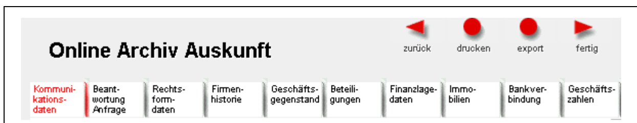
Abbildung 2.1-8: Bürgel. NetCheck. Datenelemente eines Datensatzes

Die optische und ergonomische Aufbereitung des Webauftritts ist klar und den Bedürfnissen eines Kunden angemessen, der konkret nach der Wirtschaftsauskunft eines Unternehmens sucht. Besonders gelungen erscheint uns die Einteilung dieser Dossiers in Auskunftselemente. Je nach gewähltem Produkt werden für die einzelnen Firmendossiers unterschiedliche Informationselemente angezeigt (Abbildung 2.1-8).