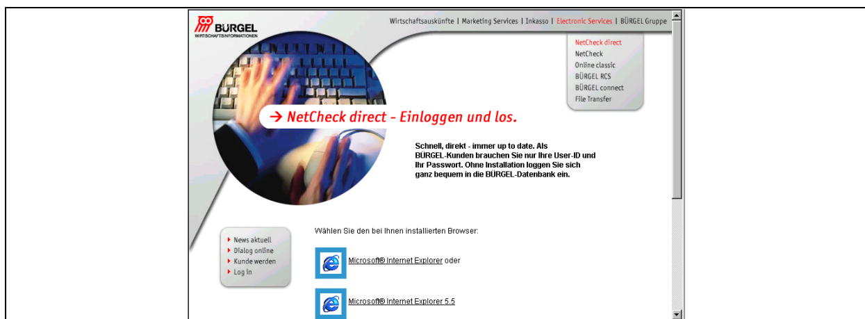
Abbildung 2.1-2: Bürgel. NetCheck Eingangsbildschirm

Die einzelnen Bürgel-Partner sind zwar Teil des umfassenden Franchise-Systems, kalkulieren jedoch ihre Preise selbständig. Damit können wir hier nicht den Preis der Produkte nennen, wohl aber Anhaltspunkte liefern. Neben einer Jahresmitgliedschaft fallen einmalige Lizenzgebühren für die Onlinenutzung und Kosten für die Anfragen an. Die Preise sind mengenabhängig. Eine Preisreduktion kann beim Kauf von Kontingenten erzielt werden. Als Anhaltspunkt sollte der Kunde beim Kauf von 20 Anfrageeinheiten mit rund 50,-- DM pro Einheit rechnen.