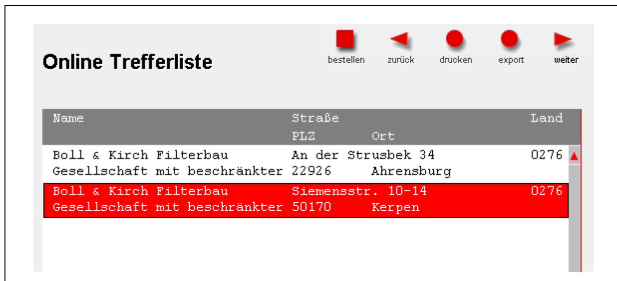
Abbildung 2.1-7: Bürgel. NetCheck Trefferliste

Über "bestellen" initiiert der Kunde eine Überprüfung des bestehenden Firmenporträts, das innerhalb kurzer Zeit ins persönliche Archiv gestellt wird.