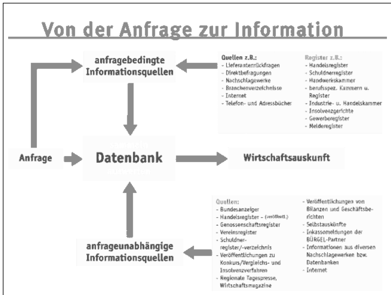
Abbildung 2.1-3: Informationsquellen bei Bürgel (Quelle: Bürgel)