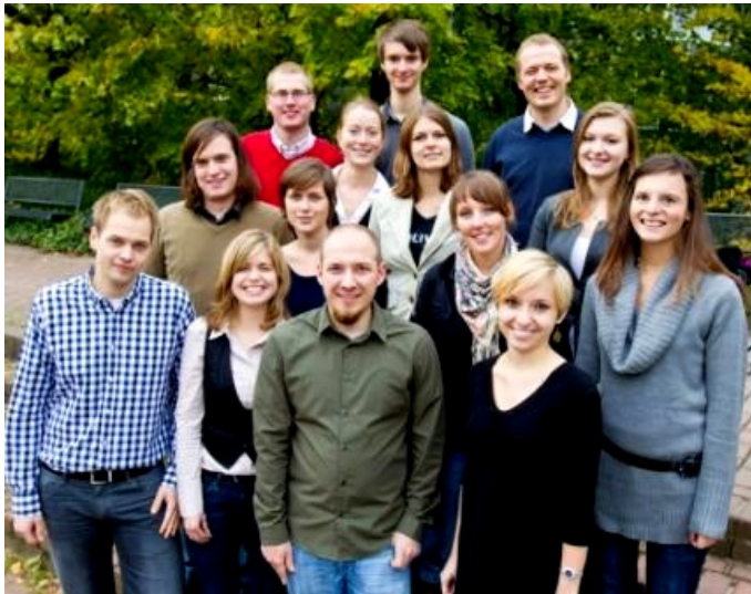
Das Organisationsteam aus Studierenden des Masterstudiengangs "Politische Kommunikation".