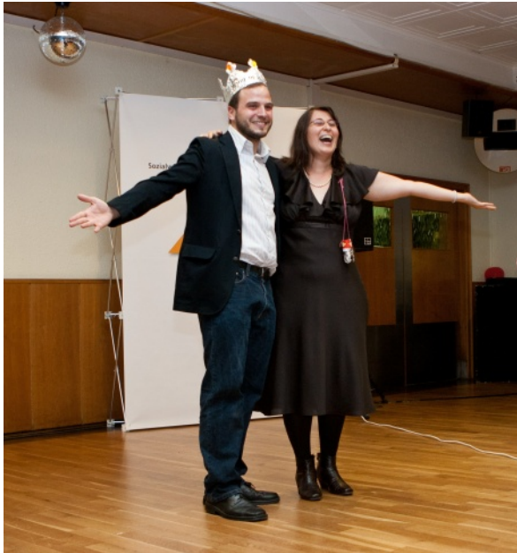
King und Queen of Hearts bei der Ausübung ihrer repräsentativen Pflichten.

Der Juli 2011 wird als „für die Jahreszeit zu kühl“ in die Chroniken des deutschen Wetteramtes eingehen: Seit Tagen hat es bei eher herbstlicher Witterung geregnet. Lange sah es danach aus, als würde der traditionelle Wurf der Bachelorhüte dieses Jahr von der Saaldecke begrenzt werden, doch dann sind an diesem Freitagmorgen die Wolken aufgerissen und die Temperaturen im Laufe des Tages um 15 Grad geklettert. Jetzt drängen die Absolventinnen und Absolventen des BA Sowi, die eben ihre symbolischen Zeugnismappen erhalten haben, lachend und rufend ins Freie. Einige Minuten später – der Fotograf muss eine Weile fuchteln, bis er alle stolzen Eltern und liebenden Partner aus dem Bild dirigiert hat – fliegen die Hüte einem immer noch strahlenden Abendhimmel entgegen.