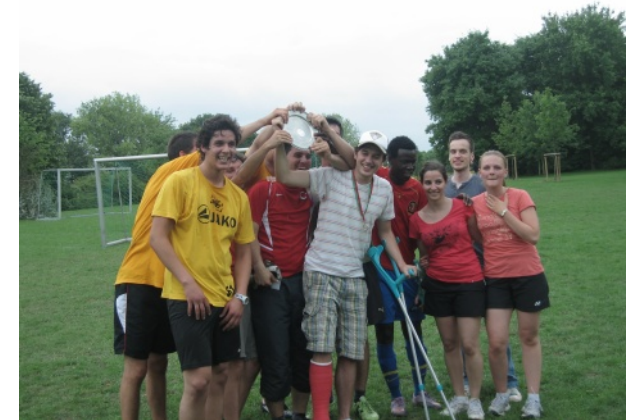
Sieger des Rabbit Cup 2011: Class of Culture.