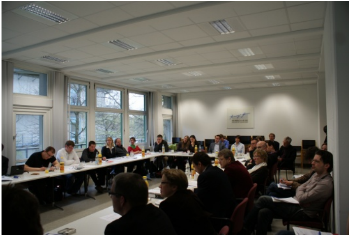
Rege Diskussionen fanden unter den Teilnehmern des Graduiertenkollegs statt.

Mitarbeiter des Instituts und externe Experten diskutierten das Forschungsprogramm des zukünftigen Graduiertenkollegs