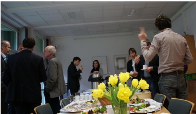
Bei einem kleinen Snack lässt sich gut diskutieren.

Dort, wo sonst die hoheitlichen Sitzungen der Philosophischen Fakultät abgehalten werden, traf sich zu Beginn des Sommersemesters das Kollegium des Instituts für Sozialwissenschaften. Ebenfalls eingeladen waren externe Experten, um das Forschungsprogramm des Graduiertenkollegs zu diskutieren, das zum Wintersemester am Institut eingerichtet werden soll.