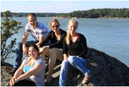
Mit alten und neuen Kommilitonen auf der Insel Maanpää.