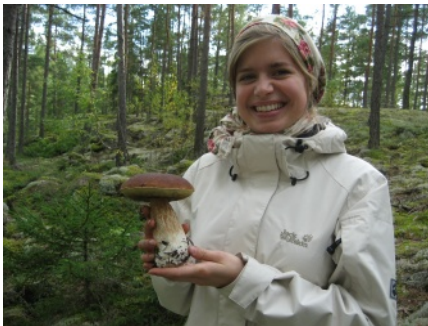
Mit Steinpilz und Kopftuch gegen die Elchfliegen. In Finnland gilt das Jedermannsrecht: Pilze und Beeren darf jeder überall sammeln.