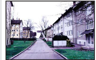
Stadtteilmanagement am Beispiel Lindau-Zech