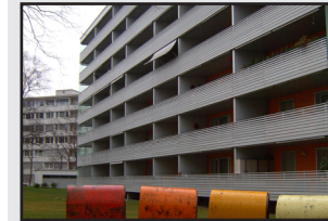
Geschlechter -und generationenübergreifende Quartierarbeit.