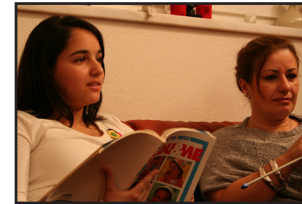
Erziehungsthemen unterhaltsam als Kurzfilme aufbereitet.