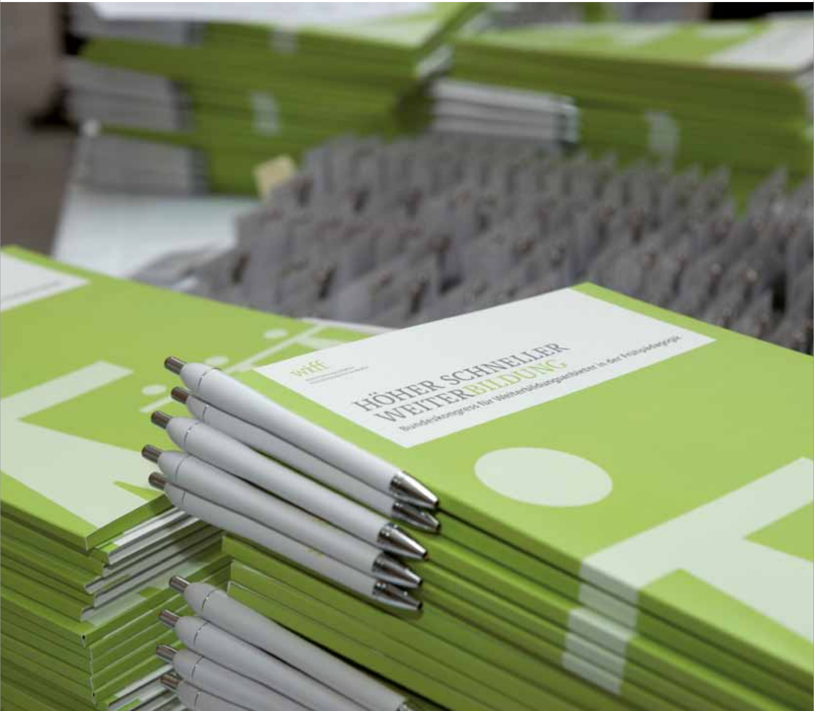
Bundeskongress für Weiterbildungsanbieter in der Frühpädagogik im ddb forum berlin