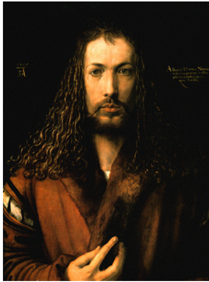
Albrecht Dürer, Selbstportrait 1500