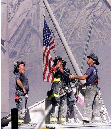
Feuerwehrleute am Ground Zero 2001