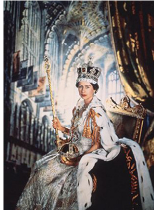
Konigin Elisabeth II. 1953