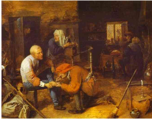
Adriaen Brouwer, Die Operation/Dorfbadestube (um 1631)