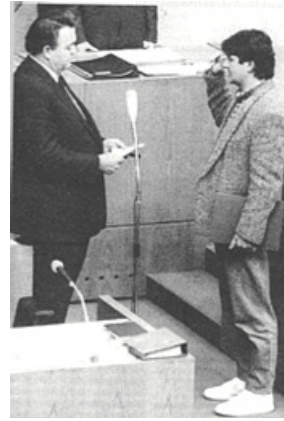
Joschka Fischer 1985