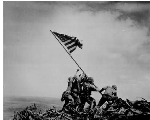
Schlacht um Iwo Jima 1945