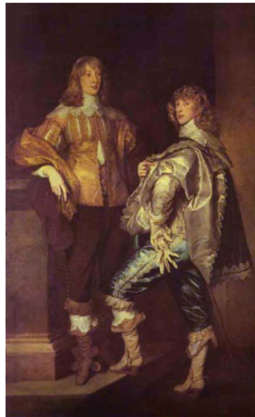
Lord John und Bernard Stuart (um 1638)