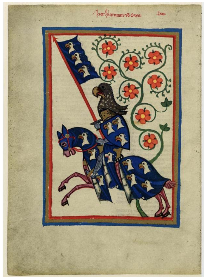
Abb. aus dem Codex Manesse ; Hartmann von Aue